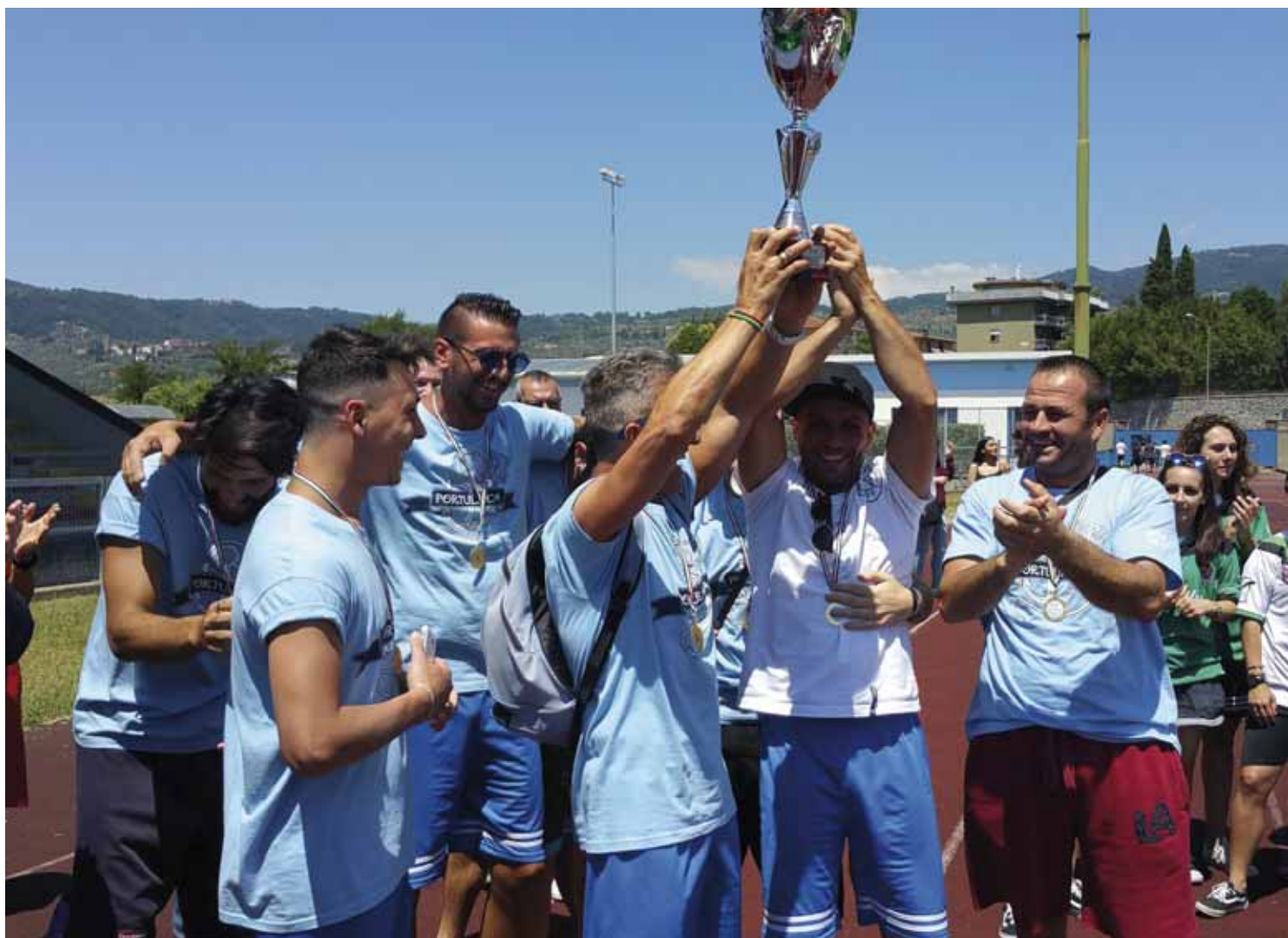
1. Classificata C5 - Gold Bet Smile Trani

Sui campi da gioco è forte lo spirito di com-