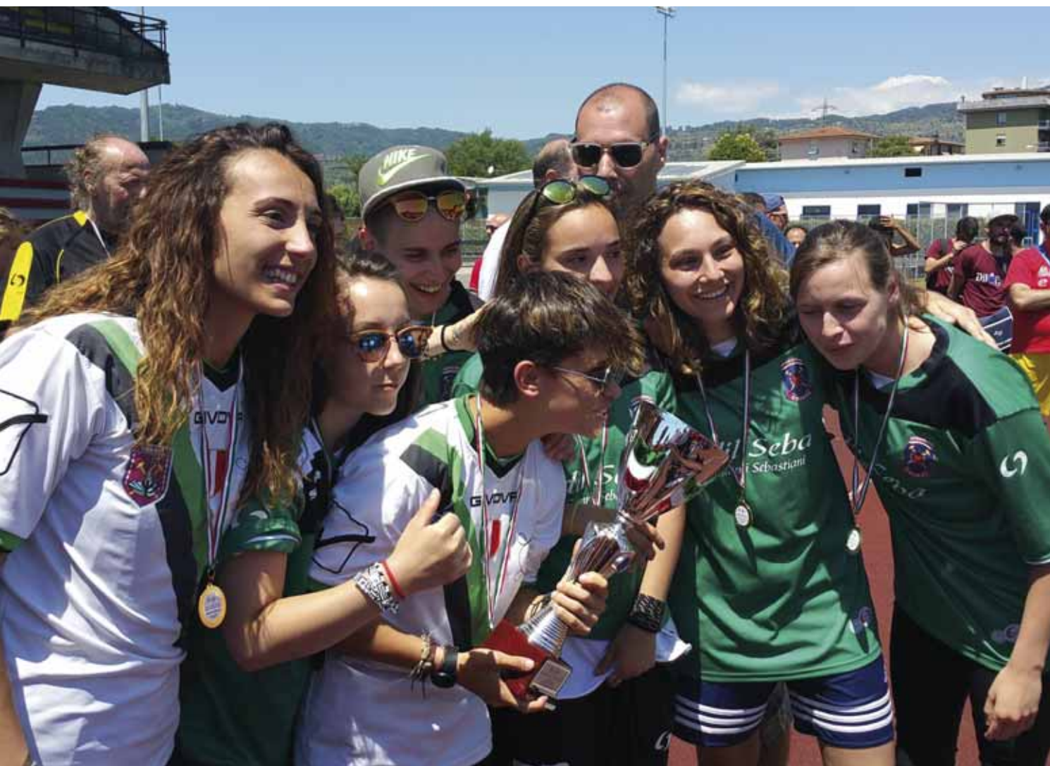
1. Classificata C5 femminile - Futsal Chieti

Montecatini Terme ha ospitato la manifestazione che ha visto protagonisti oltre 300 atleti in una tre giorni che ha regalato divertimento ma anche sana competizione. Un successo organizzativo per un settore che è un fiore all'occhiello dell'Ente